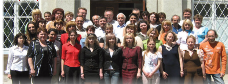
18 июня филиал Приднестровского государственного университета им. Т.Г. Шевченко в г. Рыбнице отметит 20-летие со дня основания.

Рассматривая этот период по временным меркам истории – это немного, но по насыщенности событиями – это целая эпоха в истории системы высшего профессионального образования Приднестровской Молдавской Республики.