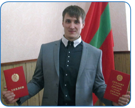
Ряды инженерного корпуса жизнеобеспечивающих отраслей Приднестровья пополнили 43 молодых специалиста.

В торжественной обстановке в Бендерском политехническом филиале ПГУ им. Т.Г. Шевченко состоялось вручение дипломов об окончании высшего профессионального образования выпускникам заочного отделения, обучавшимся по сокращенной программе по специальностям: «Автомобили и автомобильное хозяйство», «Теплогазоснабжение и вентиляция» и «Промышленное и гражданское строительство».